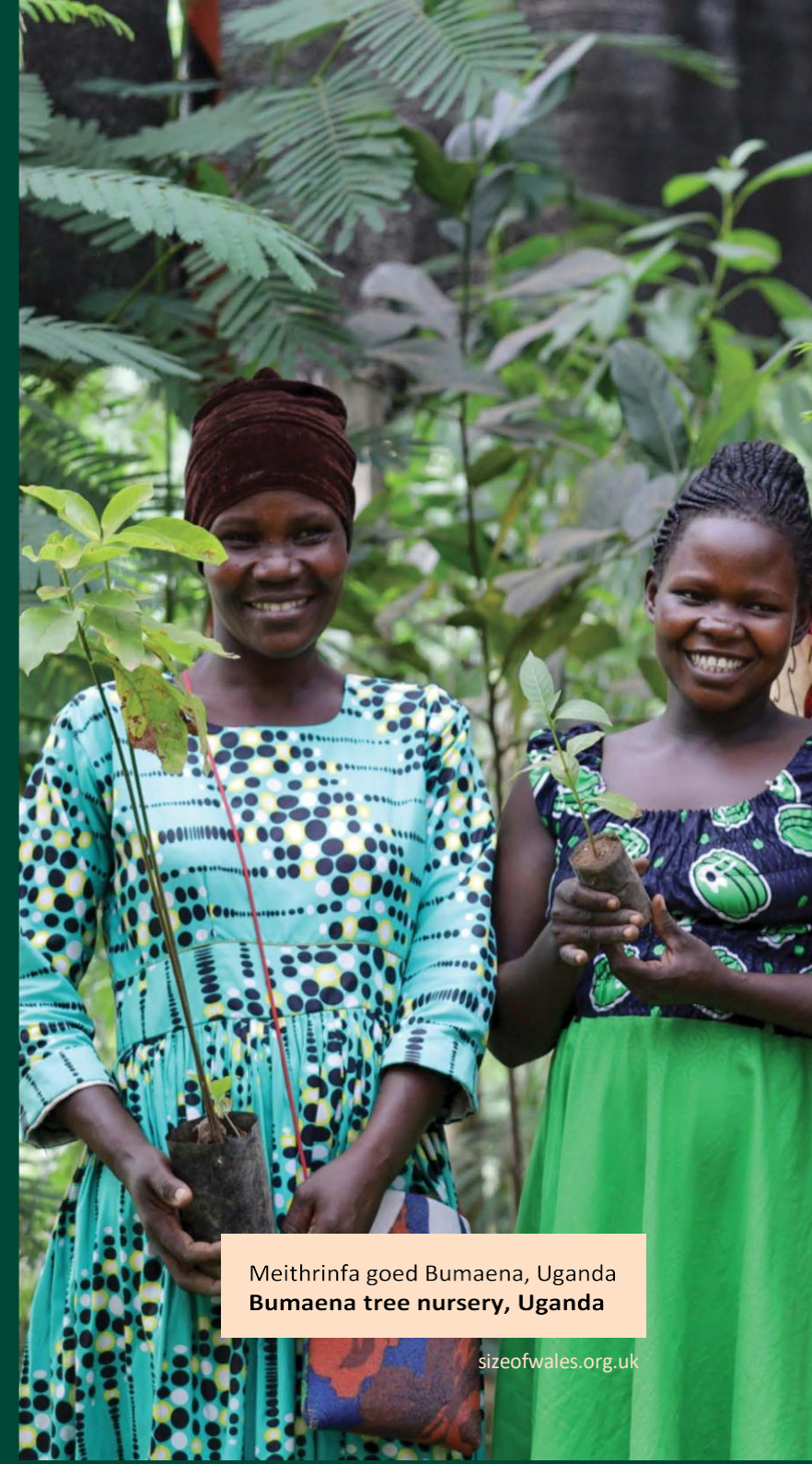
Meithrinfa goed Bumaena, Uganda Bumaena tree nursery, Uganda

In collaboration, we will build a healthier planet where people, forests and nature thrive together.