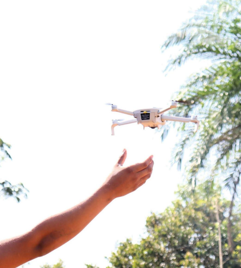
Monitro llechfeddiant anghyfreithlon gyda dr6n yn Amazon Brasil Drone pilot monitoring illegal encroachment in the Brazilian Amazon